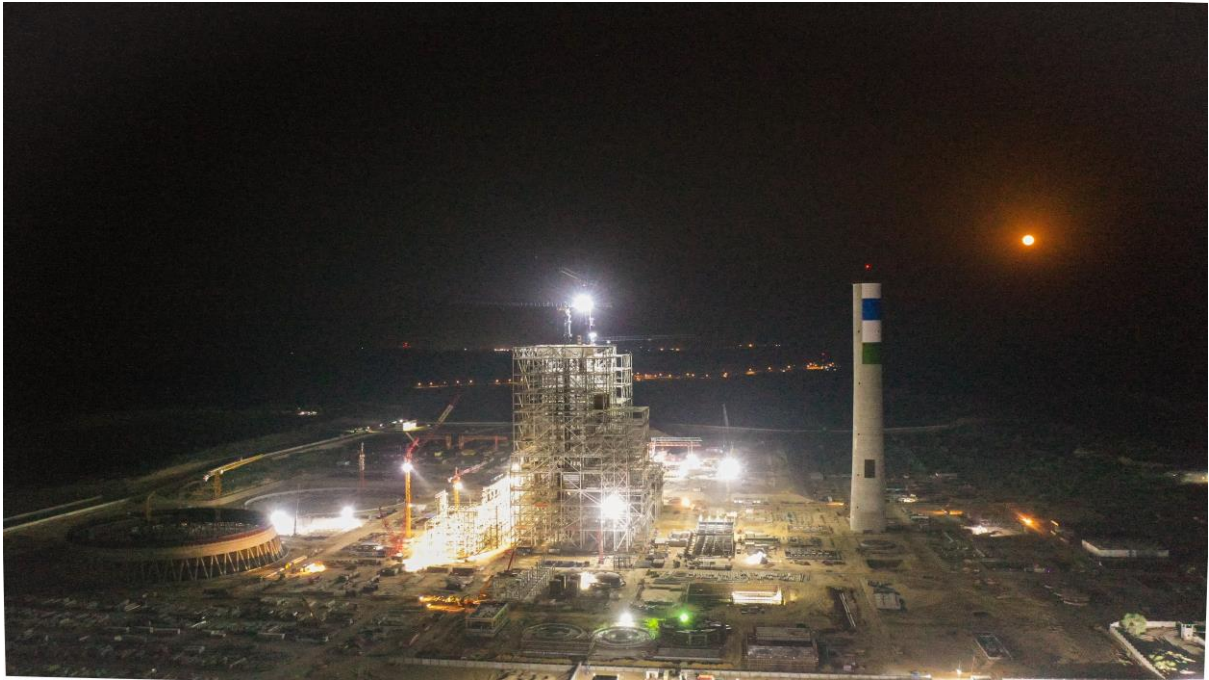
图三：“不畏浮云遮望眼，自缘身在最高层”白天的塔尔悠悠白云，雄伟壮观