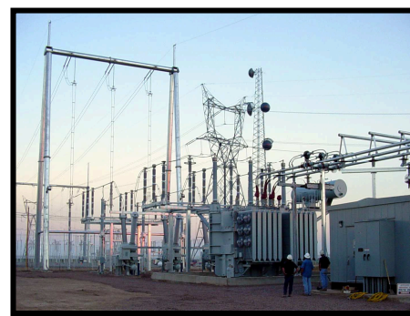
浙江广天电力设备股份有限公司 MSVC 事业部